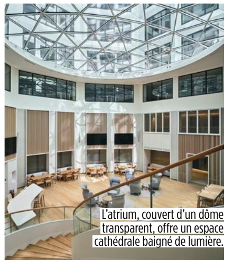
L'atrium, couvert d'un dôme transparent, offre un espace cathédrale baigné de lumière.